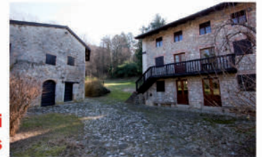
Mulino Conti d'Attimis