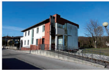
Museo Archeologico Medioevale