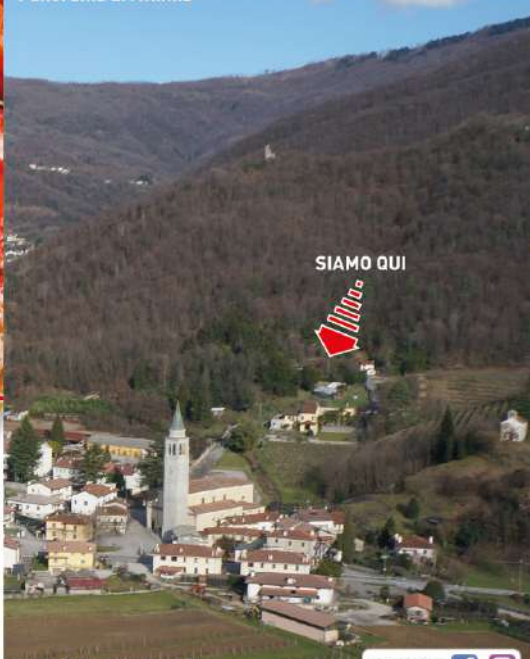
Panorama di Attimis